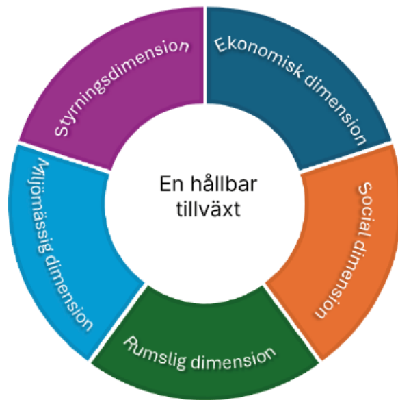
Figur 1 – Fem dimensioner i en hållbar tillväxt

I figuren nedan (Figur 1) illustreras att det krävs ett balanserat och integrerat angreppssätt där ett flertal dimensioner vävs samman till en helhet för att skapa attraktiva städer och samhällen.